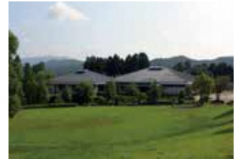
甲賀市土山歴史民俗資料館