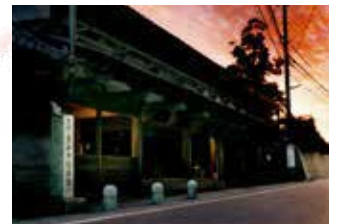
大角家住宅 旧和中散本舗