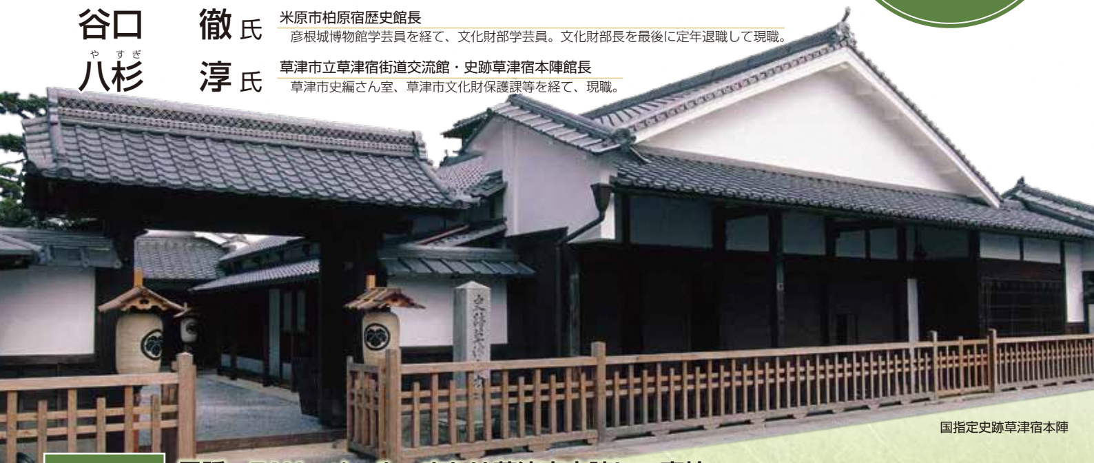
国指定史跡草津宿本陣