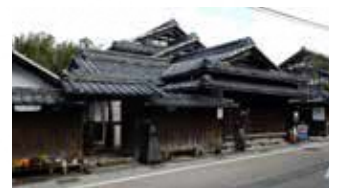
米原市柏原宿歴史館